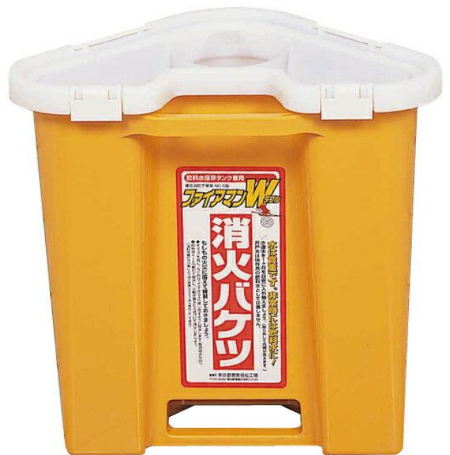
Một cái xô tuyệt chủng