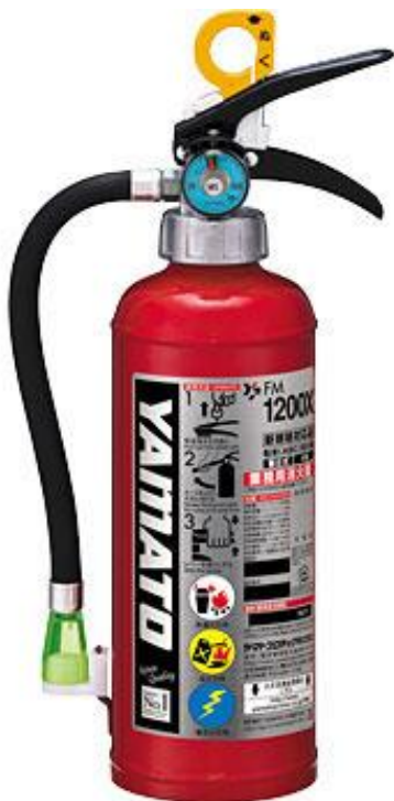
Bình chữa cháy

Khi sử dụng máy cắt, hãy quan tâm đến môi trường xung quanh!!