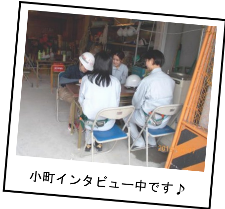
小町インタビュー中です♪