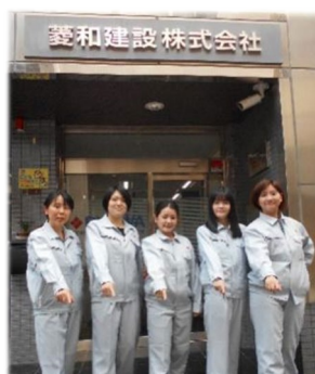
*チームカラーロゴ*