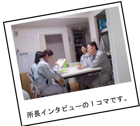
所長インタビューの1コマです。