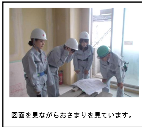
図面を見ながらおさまりを見ています。