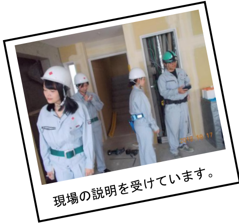
現場の説明を受けています。

2019年10月17日、18日に現場で小町研修会を開催、安全パトロールにも参加しました。