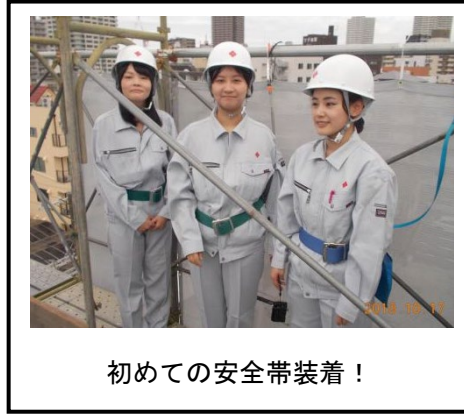
初めての安全帯装着！