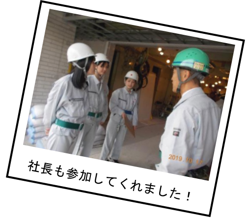
社長も参加してくれました！