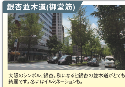
銀杏並木道(御堂筋) 大阪のシンボル、銀杏。秋になると銀杏の並木道がとても綺麗です。冬にはイルミネーションも。