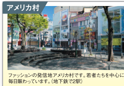
アメリカ村 ファッションの発信地アメリカ村です。若者たちを中心に毎日賑わっています。(地下鉄で2駅)