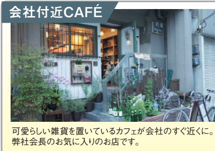
会社付近CAFÉ 可愛らしい雑貨を置いているカフェが会社のすぐ近く。弊社社長のお気に入りのお店です。