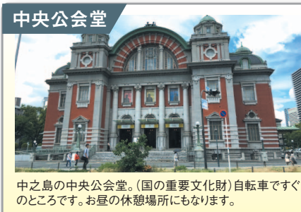
中央公会堂 中之島の中央公会堂。(国の重要文化財)自転車ですぐのところ。お昼の休憩場所にもなります。