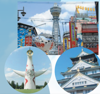
大阪城、太陽の塔、通天閣