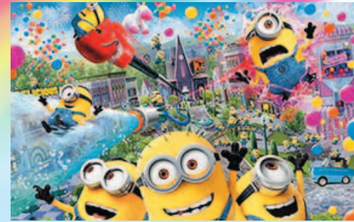
ユニバーサル・スタジオ・ジャパン