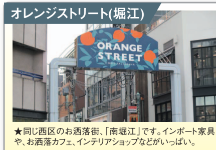
オレンジストリート(堀江) ★同じ西区のお洒落街、「南堀江」です。インポート家具や、お洒落カフェ、インテリアショップなどがいっぱい。