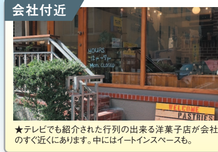
会社付近 ★テレビでも紹介された行列の出来る洋菓子店が会社のすぐ近くに。中にはイトインスペースも。