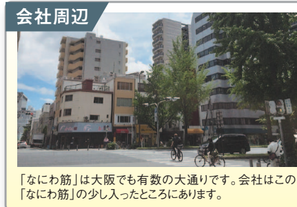
会社周辺 「なにわ筋」は大阪でも有数の大通りです。会社はこの「なにわ筋」の少し入ったところにあります。