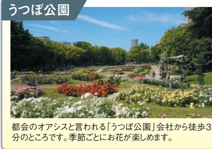
うつぼ公園 都会のオアシスと言われる「うつぼ公園」会社から徒歩3分のところ。季節ごとにお花が楽しめます。