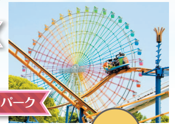
関西空港、ひらかたパーク