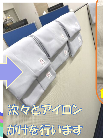
次々とアイロン がけを行います