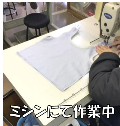
マシンにて作業中