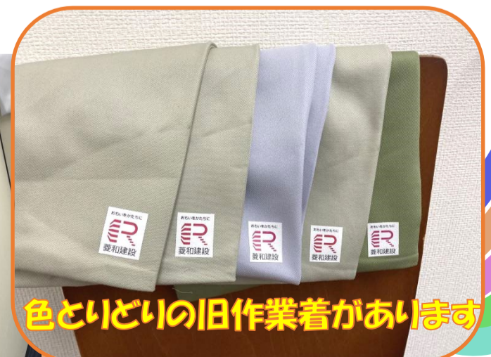
色といどりの旧作業着があります