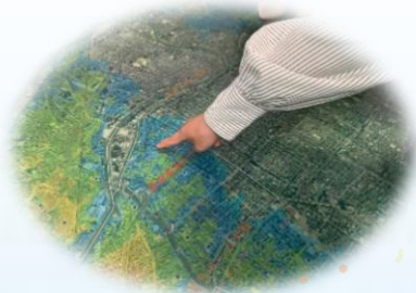
津波・高潮ハザードマップ↑

梅雨入り前に、洪水・浸水への意識を高めようということで、津波・高潮ステーションに見学にいきました。模型で海拔0メートル地帯を体感したり、水門の模型を実際に動かしたりすることで防災への意識を高めることができました。災害時、小町としてサポートできるよう尽力したいと思います。